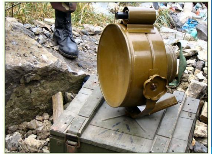
TM - 83