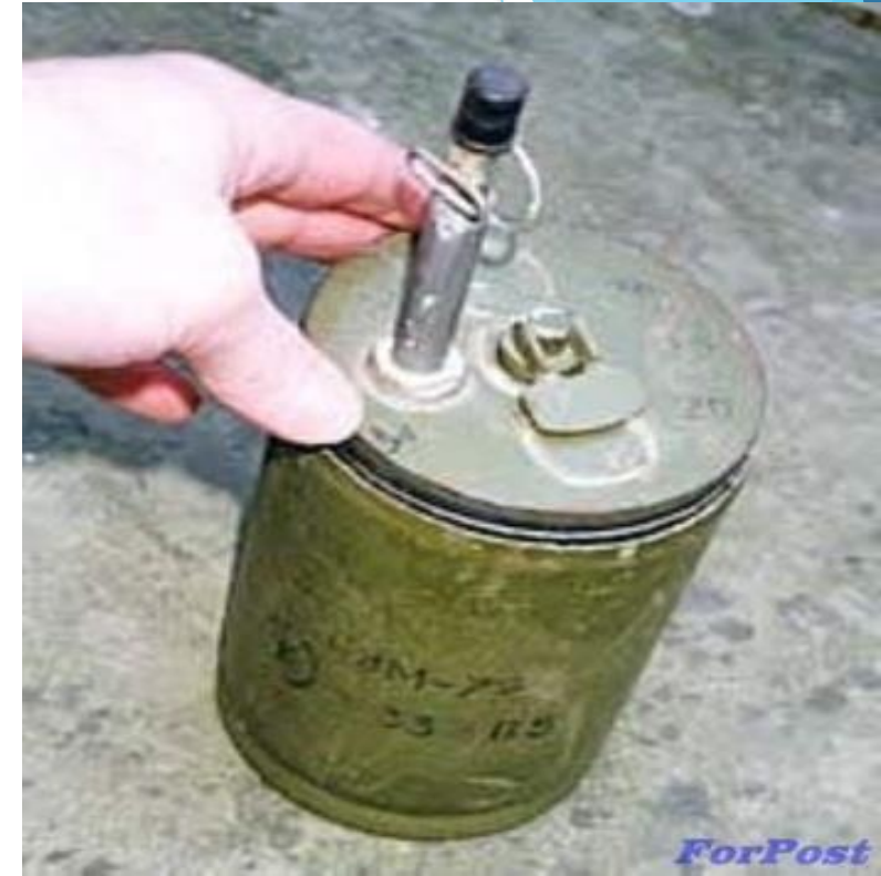
OЗМ-72 Вага- 5 кг ВР- 0.66 кг радіус ураження до 30м