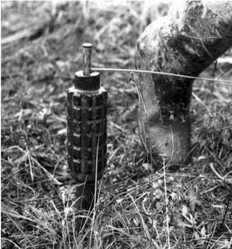
ПОМЗ-2 Вага- 1,5 кг ВР-0,75кг радіус ураження до 10 м